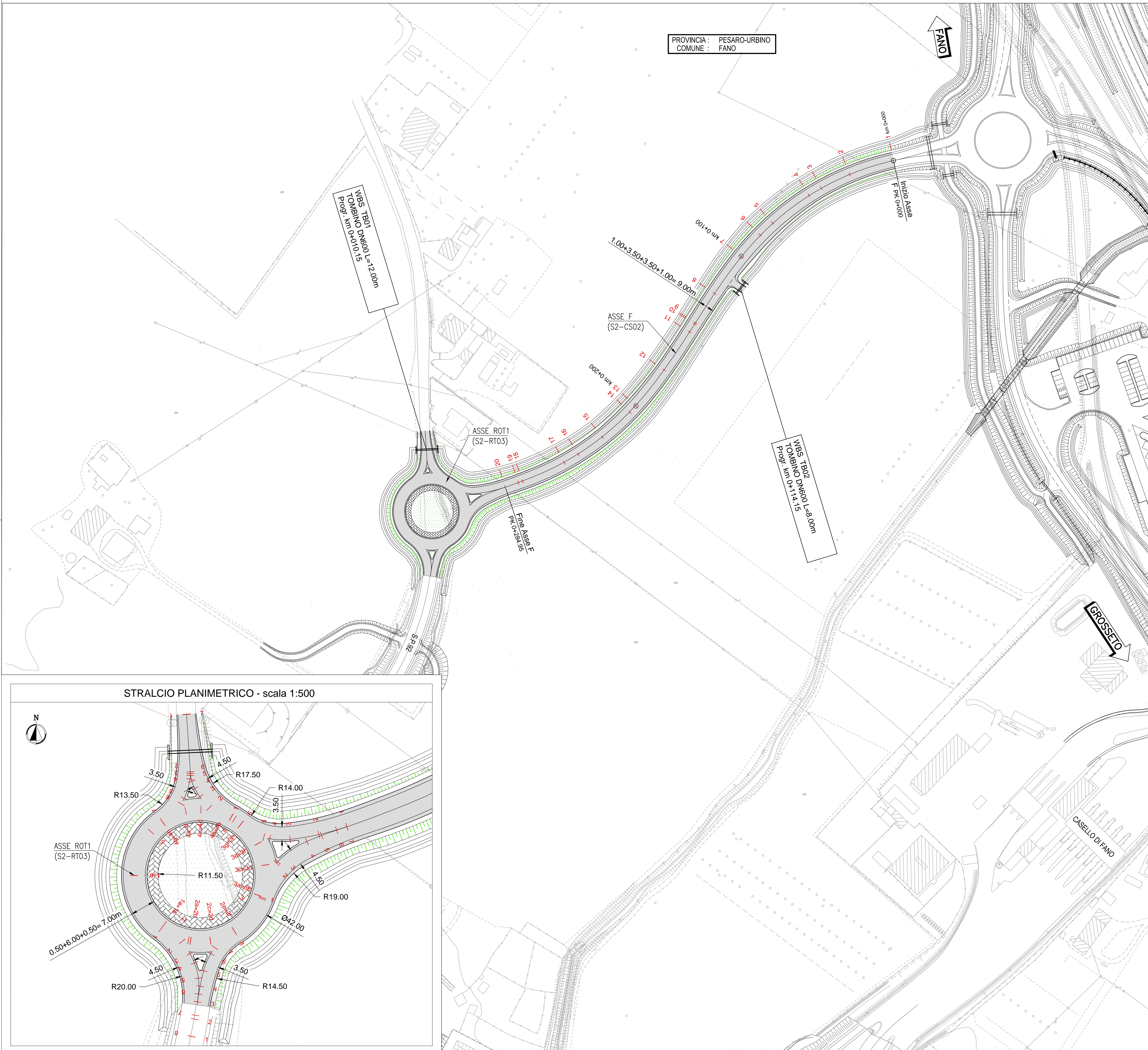
STRALCIO PLANIMETRICO - scala 1:500